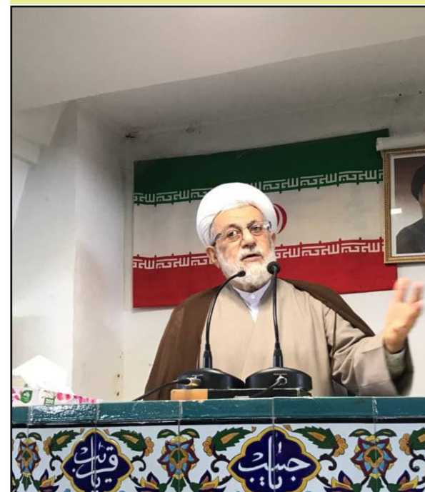
بسمه تعالی خلاصه خطبه های ۱۴۰۰/۹/۱۹ نوشهر

حجۃ الاسلام مشایخ امام جمعه محترم نوشهر در خطبه های نماز جمعه این هفته ضمن سفارش به تقوا و تبریک ولادت حضرت زینب (س) و روز پرستار و قدردانی از زحمات پرستاران مخصوصا در دوران کرونا، گفتگوی تلویزیونی ۱۴ آذر رئیس جمهور را یادآوری و به نکاتی اشاره کردند: