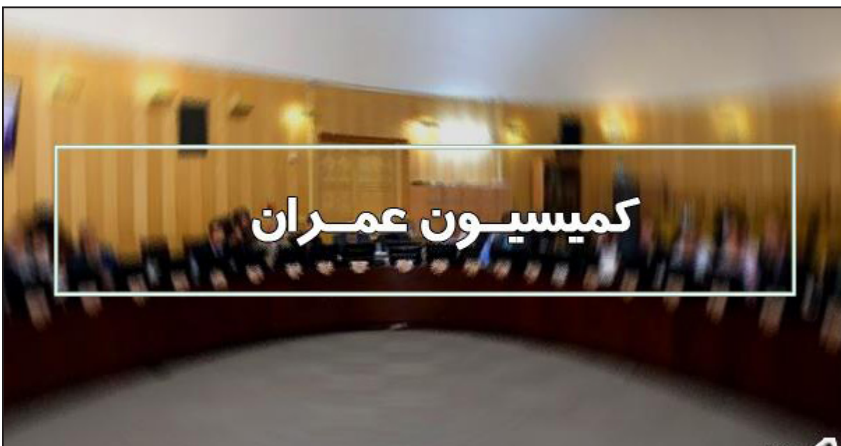
بررسی درخواست متقاضیان تحقیق و تفحص از عملکرد سازمان هواپیمایی کشوری در اجرای ماده ۲۱۲ آئین نامه داخلی مجلس شورای اسلامی نیز دستور کار دیگر کمیسیون عمران مجلس در روز دو شنبه هفته جاری است